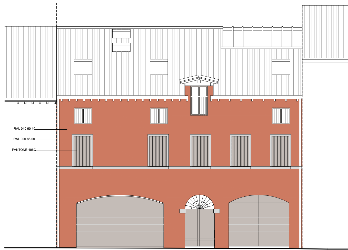
PROSPETTO EST FRONTE STRADA

ELABORATO FIRMATO DIGITALMENTE. Formato originale A1.