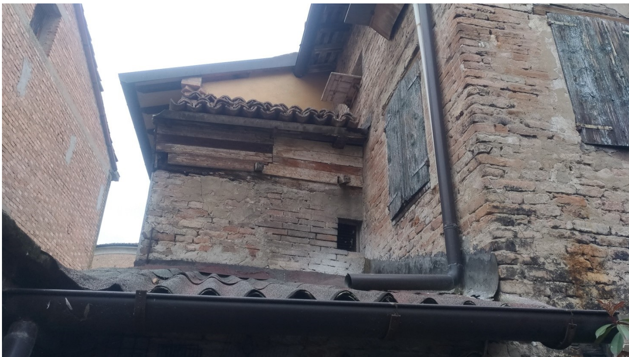
Foto 15: copertura del locale cantina da cui si esce sul cortile, in evidenza volume del ripostiglio al piano superiore