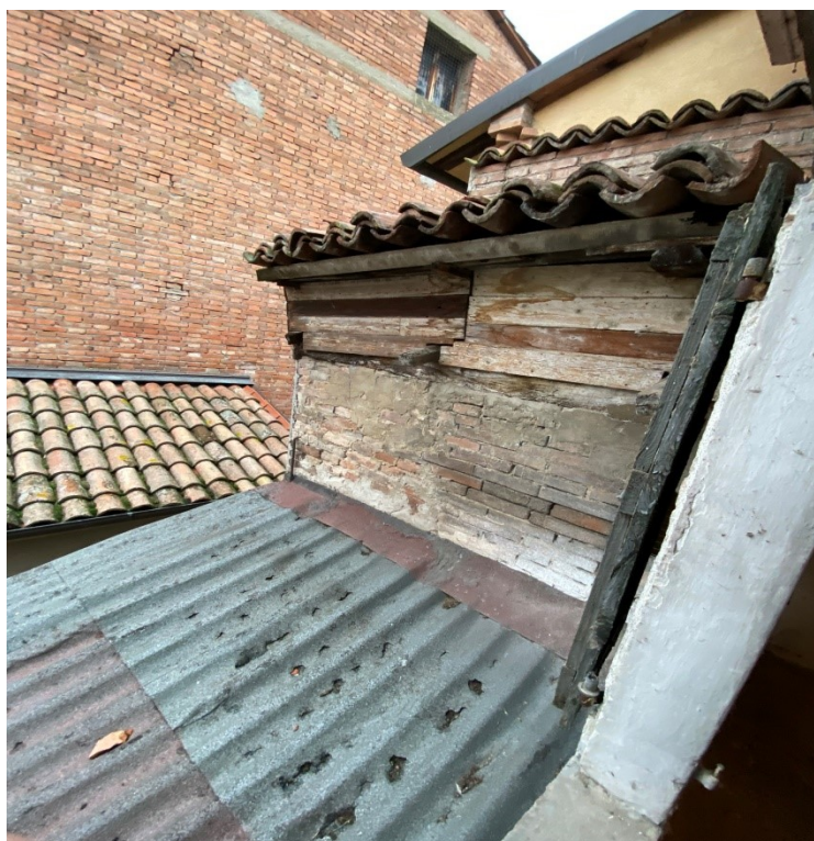
Foto 14: copertura del volume cantina e volume incongruo lato nord cortile interno visto dal primo piano