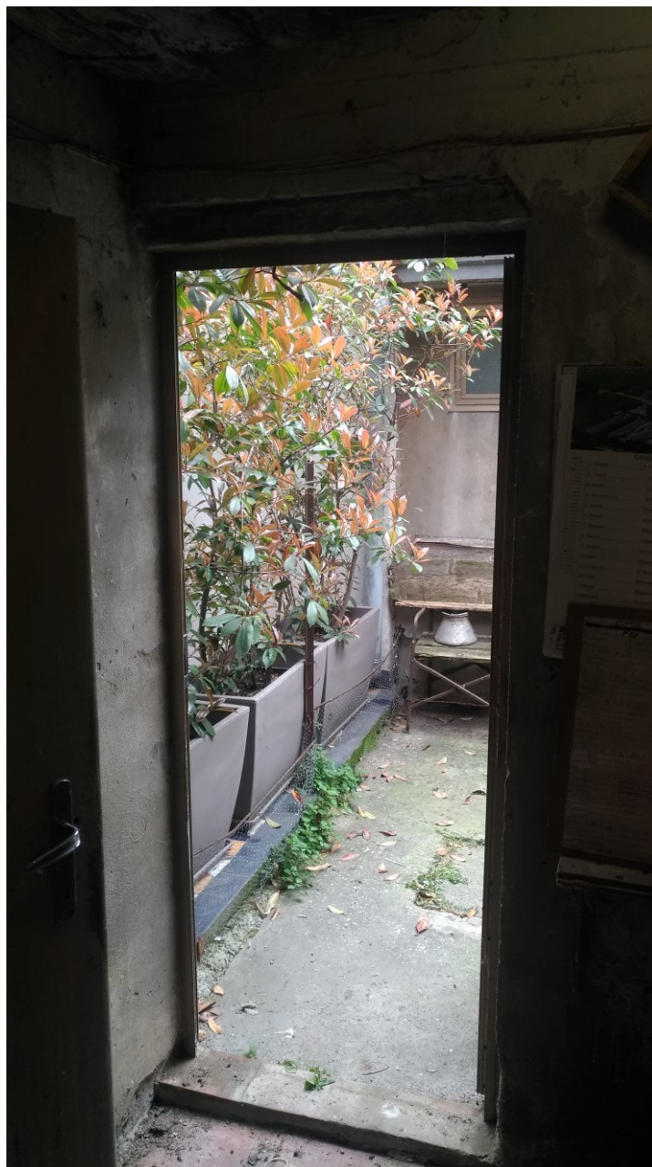
Foto 8: cortile di pertinenza con passaggio per locale wc esterno