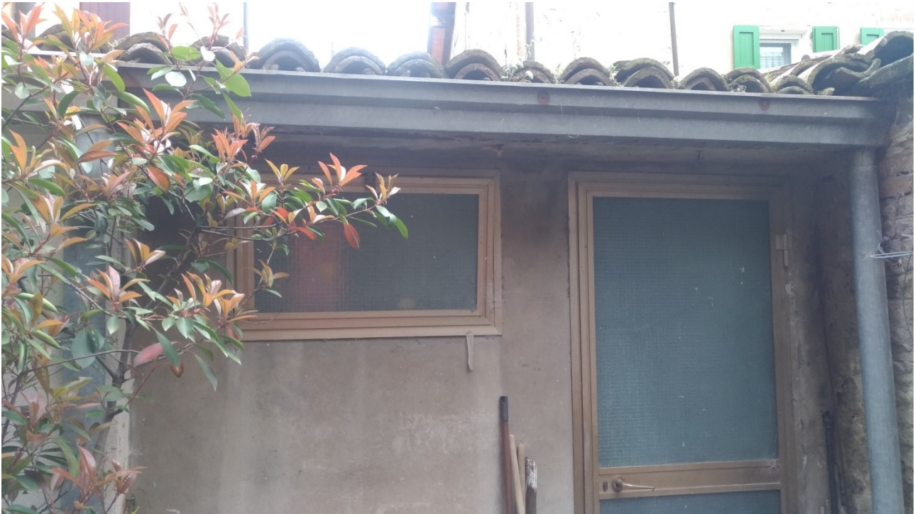
Foto 11: piano terra, bassoservizio con locale wc esterno su cortile