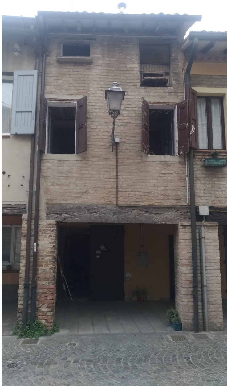
Foto 2: porzione di facciata relativa all'unità immobiliare in oggetto