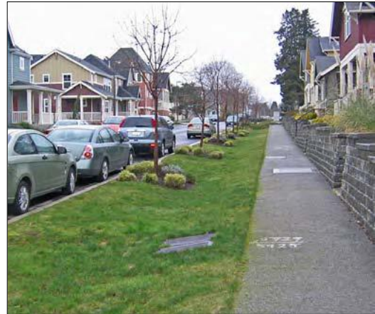
Figura 8: Un fossato d'infiltrazione (Fonte: EPA).