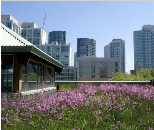
Figura 7: Un tetto verde.

Le tipologie di interventi si distinguono a seconda che si agisca in zone già urbanizzate o in nuovi insediamenti, considerando anche la densità della popolazione residente nell'area in studio. Per i nuovi insediamenti si possono prevedere dispositivi di controllo puntuali delle acque di pioggia all'interno delle stesse proprietà private; inoltre si possono individuare dei corridoi aperti di drenaggio posizionati negli spazi marginali delle particelle e/o lottizzazioni. Inoltre dovrebbero essere previsti dei sistemi superficiali di assorbimento e trattamento delle acque di dilavamento delle strade, in modo da effettuare anche una blanda depurazione degli inquinanti presenti specialmente nelle acque di prima pioggia. Nelle aree già urbanizzate si dovrebbero incentivare dei sistemi di raccolta e stoccaggio delle acque provenienti dai tetti delle singole proprietà.