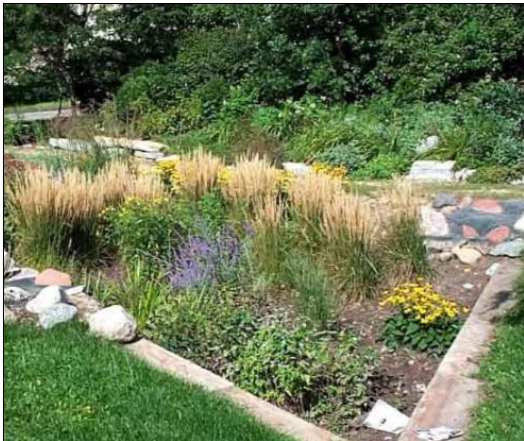
Figura 9: Un bacino di bioritenzione.