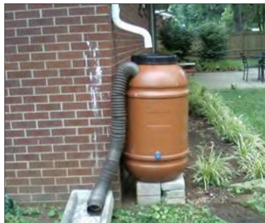
Figura 12: Una botte per lo stoccaggio domestico dell'acqua piovana.