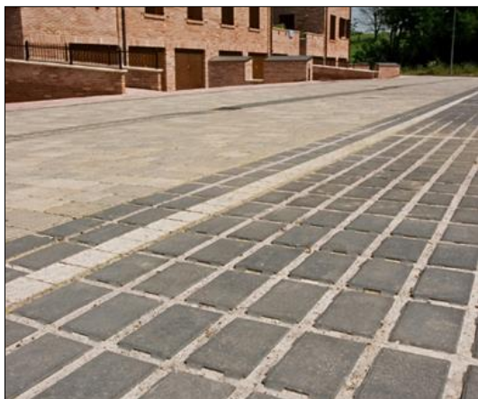
Figura 11: Una pavimentazione drenante.