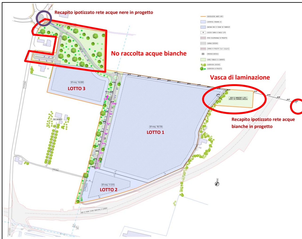
Figura 2: Schema di assetto schematico della zona in studio.

In fase di progettazione esecutiva dovranno essere rispettate le prescrizioni ed i suggerimenti operativi del parere – contributo del Consorzio di Bonifica dell'Emilia Centrale (CBEC) prot. 2017 U0011570 del 16/06/2017 al quale si rimanda.