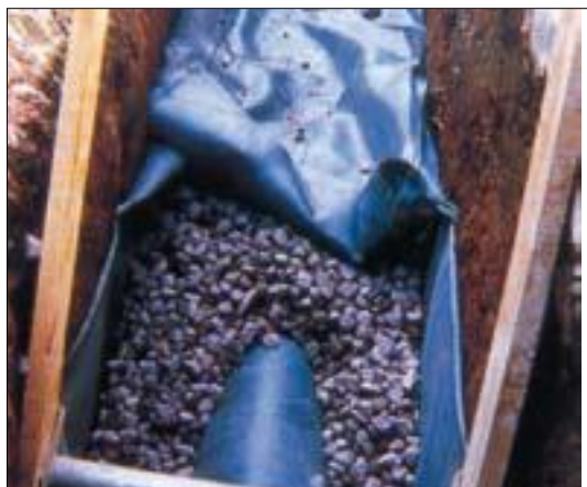
Figura 13: Una trincea d'infiltrazione.