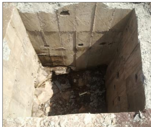
Figura 14: Un pozzo a perdere.

Per migliorare l'assorbimento delle acque meteoriche e per contribuire a prevenire l'inquinamento da fonti diffuse, in seguito vengono riportati i più efficienti strumenti pratici tra le principali tecniche di infiltrazione e/o stoccaggio (B.P.M. - Best Management Practice):