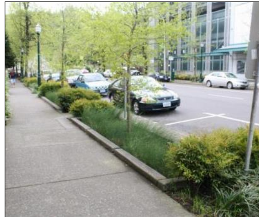
Figura 10: Un'aiuola d'infiltrazione.