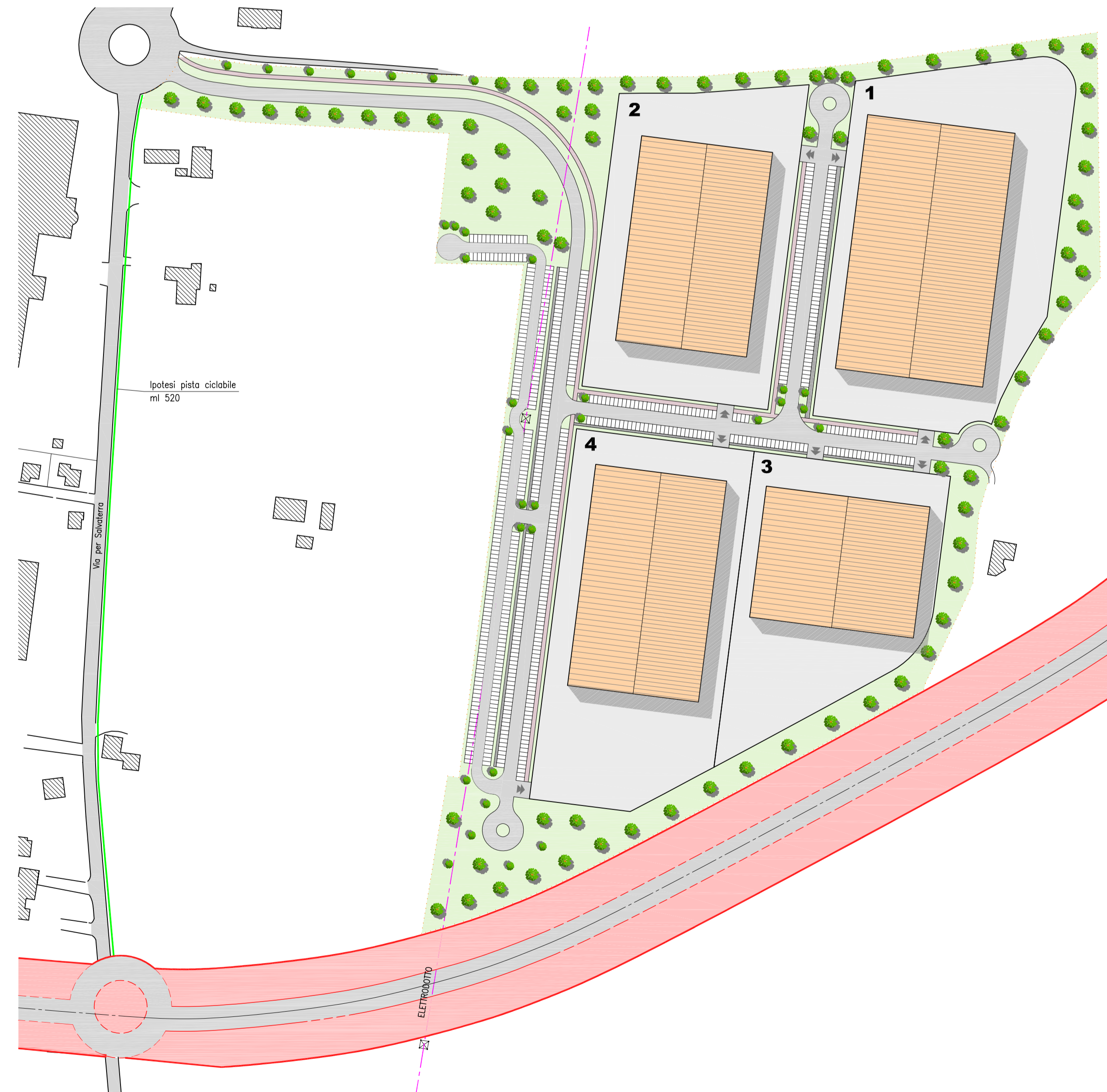
IPOTESI 1 - Planimetria scala 1:2000